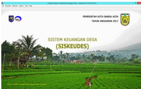
Gambar 2. Tampilan Awal Aplikasi Siskeudes Didalam Aplikasi siskeudes mempunyai menu file, parameter, data entri, Laporan, tool, dan help

2. Tampilan Menu From Login Adapun tampilan from login aplikasi siskeudes dapat dilihat pada gambar 3. berikut: