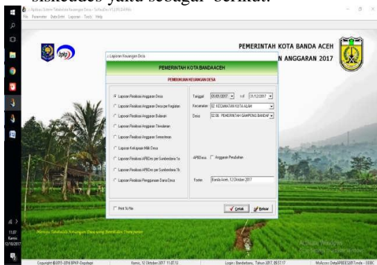
Gambar 4. Tampilan Menu laporan

Adapun tampilan menu laporan aplikasi siskeudes yaitu sebagai berikut: