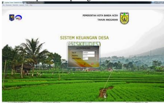
Gambar 3. Tampilan From login

2. Tampilan Menu From Login Adapun tampilan from login aplikasi siskeudes dapat dilihat pada gambar 3. berikut: