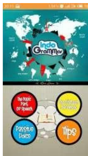
Gambar 4.3 Menu Utama