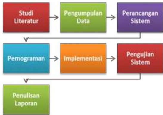
Gambar 3.2 Diagram Alur Penelitian