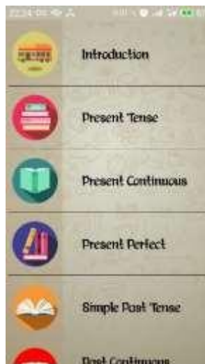
Gambar 4.6 Submenu Passive Voice

Pada submenu passive voice berisi sembilan list ( Present, Present Continuous, Present Perfect, Simple Past, Past Continuous, Past Perfect, Simple Future, Future Continuous, Future Perfect ) setiap list yang dipilih pengguna, aplikasi akan menampilkan materi sesuai dengan pilihan pengguna. Tampilan submenu passive voice seperti Gambar 4.6.