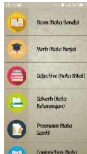
Gambar 4.4 Submenu The Basic Part Of Speech

Pronoun, Conjunction, Preposition dan Interjection ) setiap list yang dipilih pengguna, aplikasi akan menampilkan materi sesuai dengan pilihan pengguna. Tampilan submenu the basic part of speech seperti Gambar 4.4.