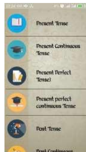
Gambar 4.5 Submenu The Sixteen Of Tenses

Pada submenu the sixteen of tenses berisi enam belas list ( Present, Present Continuous, Present Perfect, Present Perfect Continuous, Past, Past Continuous, Past Perfect, Past Perfect Continuous, Future, Future Continuous, Future Perfect, Future Perfect Continuous, Past Future, Past Future Perfect, Past Future Perfect Continuous ) setiap list yang dipilih pengguna, aplikasi akan menampilkan materi sesuai dengan pilihan pengguna. Tampilan submenu the sixteen of tenses seperti Gambar 4.5.