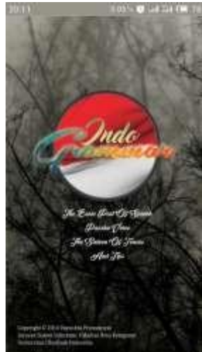
Gambar 4.2 Splash Screen

Splash Screen adalah sebuah gambar yang muncul pertama pada saat aplikasi di jalankan, Splash Screen berisi informasi singkat tentang gambaran aplikasi yang ditampilkan secara cepat. Tampilan splashscreen seperti Gambar 4.2