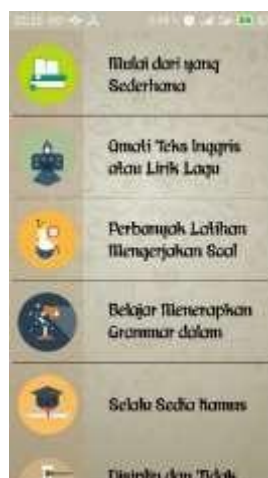
Gambar 4.7 Submenu Tips

Pada submenu tips berisi sembilan list (mulai dari yang sederhana, amati teks inggris atau lirik lagu, perbanyak latihan mengerjakan soal, menerapkan grammar dalam speaking, selalu sedia kamus, disiplin dan tidak mudah menyerah setiap list yang dipilih pengguna, aplikasi akan menampilkan materi sesuai dengan pilihan pengguna. Tampilan submenu tips seperti Gambar 4.7.