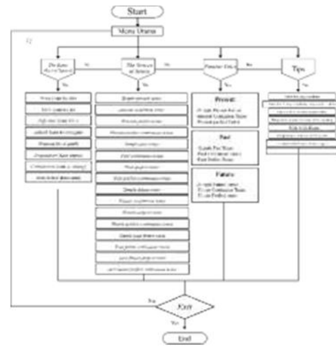
Gambar 3.3 Flowchart Aplikasi Menu Utama