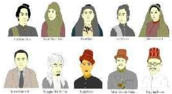
Gambar 4.1 Hasil Desain Karakter Tokoh Pahlawan Aceh

Dalam mendesain karakter tokoh pahlawan, penulis menggunakan software adobe flash professional CS5 . Objek yang didesain sesuai dengan gambar aslinya. Hasil gambar yang didesain bisa dilihat pada tampilan gambar 4.1.