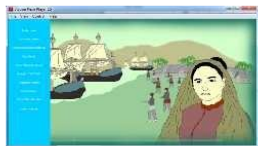
Gambar 4.12 Tampilan Animasi Pengenalan Pahlawan Keumalahayati

Tampilan animasi ini juga merupakan tampilan yang menceritakan sejarah perjuangan cut nyak dhien pada masa penjajahan Belanda terhadap Aceh.