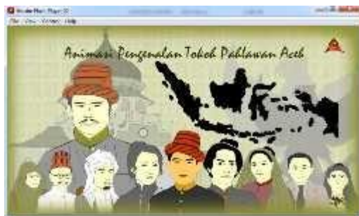
Gambar 4.9 Tampilan Utama Animasi Pengenalan Tokoh Pahlawan Aceh

hasil akhir yang didapatkan pada penelitian ini dalam pembuatan animasi pengenalan tokoh pahlawan Aceh berbasis adobe flash , bisa dilihat pada gambar-gambar berikut ini.