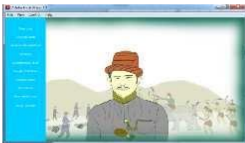
Gambar 4.14 Tampilan Animasi Pengenalan Pahlawan Sultan Iskandar Muda

Tampilan animasi ini merupakan tampilan yang menceritakan sejarah perjuangan cut meutia pada masa penjajahan Belanda terhadap Aceh.