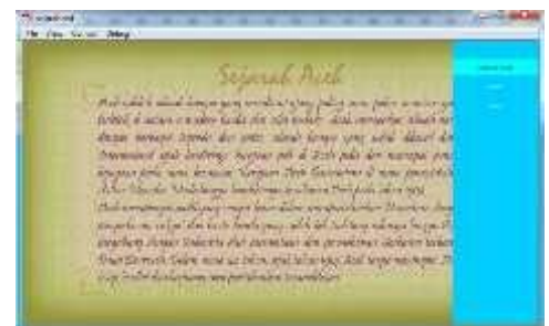
Gambar 4.20 Tampilan Halaman Sejarah Aceh

Tampilan animasi ini menceritakan tentang sejarah perjuangan pocut meurah intan pada masa penjajahan Belanda terhadap Aceh.