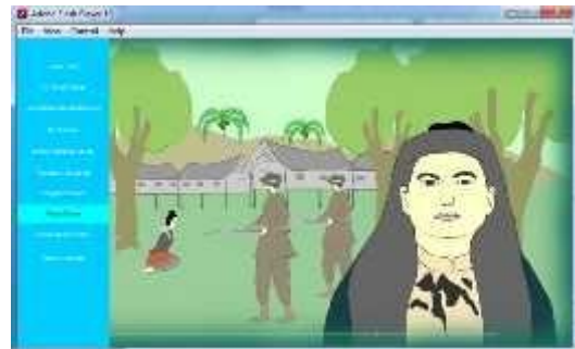
Gambar 4.17 Tampilan Animasi Pengenalan Pahlawan Pocut Baren

Tampilan animasi ini menceritakan sejarah perjuangan dari panglima polem pada masa penjajahan Belanda terhadap Aceh.