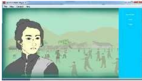
Gambar 4.13 Tampilan Animasi Pengenalan Pahlawan Cut Meutia

Tampilan animasi ini merupakan tampilan yang menceritakan sejarah perjuangan cut meutia pada masa penjajahan Belanda terhadap Aceh.