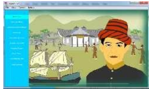
Gambar 4.10 Tampilan Animasi Pengenalan Pahlawan Teuku Umar

proses animasi berjalan maka akan menampilkan semua tokoh pahlawan yang akan diperkenalkan.