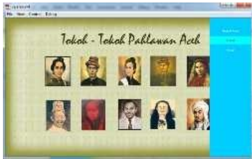
Gambar 4.21 Tampilan Halaman Galeri

Tampilan halaman ini cuma menampilkan gambar-gambar asli dari tokoh pahlawan Aceh dengan tujuan untuk mengenal tokoh asli dari para pahlawan.