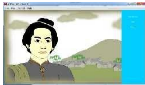
Gambar 4.11 Tampilan Animasi Pengenalan Pahlawan Cut Nyak Dhien

Tampilan animasi ini hanya menceritakan tentang sejarah perjuangan teuku umar pada masa penjajahan Belanda terhadap Aceh.