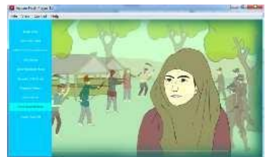
Gambar 4.18 Tampilan Animasi Pengenalan Pahlawan Pocut Meurah Intan

Tampilan animasi ini menceritakan sejarah perjuangan pocut baren pada masa penjajahan Belanda terhadap Aceh.