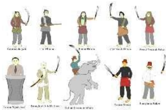
Gambar 4.2 Gambar Animasi Bergerak