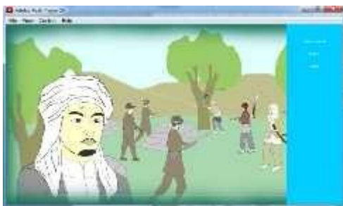
Gambar 4.15 Tampilan Animasi Pengenalan Pahlawan Teungku Chik Di Tiro

Tampilan animasi ini merupakan tampilan yang menceritakan sejarah perjuangan sultan iskandar muda pada masa penjajahan Portugis terhadap kerajaan Aceh.