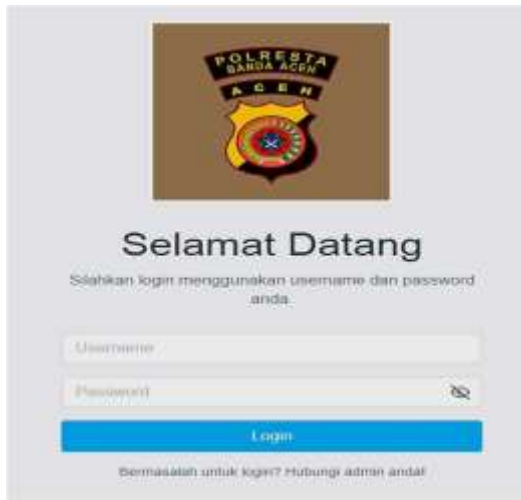
Gambar 6. Form Login

Tampilan Form Utama Admin Polresta setelah di akses login berhasil dilakukan, dapat dilihat pada Gambar 7.