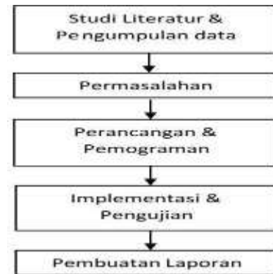
Gambar 1. Alur Penelitian.

Objek yang dikaji pada penelitian ini adalah rancangan Sistem Informasi Daftar Pencarian Orang (DPO) secara lengkap beserta laporan-laporan. Sementara itu, alur penelitian ini memiliki beberapa tahapan, seperti: studi literatur, pengumpulan data, perancangan, pemograman, implementasi dan pengujian aplikasi serta pembuatan laporan. Berikut akan dijelaskan tahapan- tahapan alur proses dalam penelitian ini sesuai urutan dalam gambar alur penelitian. Adapun alur penelitian dan penjelasan di tiap tahapan dapat dilihat pada Gambar 1. berikut: