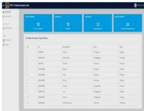
Gambar 7. Form Utama Admin Polresta

Tampilan Form Utama Admin Polresta setelah di akses login berhasil dilakukan, dapat dilihat pada Gambar 7.