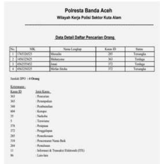
Gambar 9. Form Rekap Laporan DPO.

Tampilan Rekap Laporan DPO setelah di Cetak, dapat dilihat pada Gambar 9.