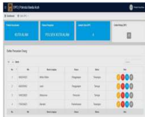
Gambar 8. Form Utama User Polsek

Tampilan Form Utama User Polsek setelah akses login berhasil dilakukan, dapat dilihat pada Gambar 8.