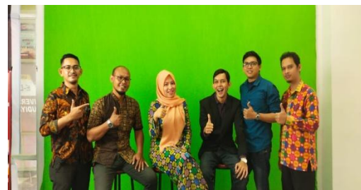
Gambar 3. Foto Bersama Pemateri dan Moderator

Gambar 1 dan 2. Bagian dari materi menjelaskan terkait dengan Bagaimana dapat menyelesaikan skripsi selama 1 semester yang dimulai dari bulan pertama sampai dengan bulan ke enam, dimana setiap bulannya memilki kegiatan yang berbeda dan harus fokus.