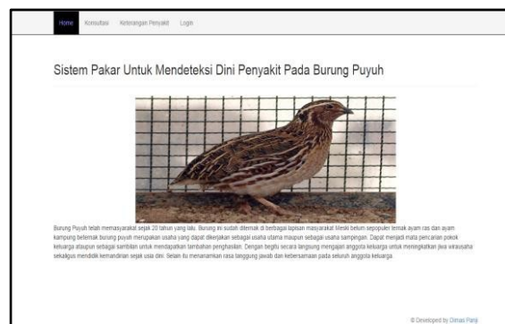
3.3 Menu Home

Dan dapat di lihat di bawah ini menu home dan hasil prediksi penyakit yang di implementasikan ke sistem yang dimana ada hasil prediksi yang dapat mendiagnosa penyakit dan ada cara pengobatan, cara pencegahan dan gambar dari penyakit yang terdeteksi :