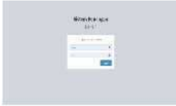
Gambar 0.1 Halaman Login

Halaman Login merupakan proses masuk ke halaman utama dengan memasukkan identitas akun yang terdiri dari username / akun pengguna dan password untuk mendapatkan hak akses jika password salah atau username salah maka login akan gagal, seperti pada gambar 4.1.