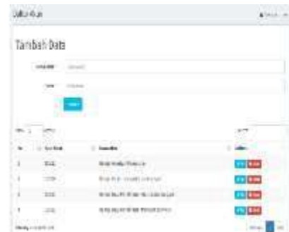
Gambar 0.6 Daftar Akun

Daftar akun terdapat menu untuk menambahkan akun yang diperlukan, terdapat juga menu mengubah data akun beserta menghapus akun dan menampilkan akun yang sudah diinput. Bisa dilihat pada gambar 4.6.