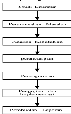
Gambar Alur Penelitian

Adapun yang menjadi subjek pada penelitian ini adalah rancang bangun aplikasi pengelolaan keuangan BNNP Aceh. Tahapan – tahapan dalam penelitian yang akan dilakukan dapat dilihat pada gambar.