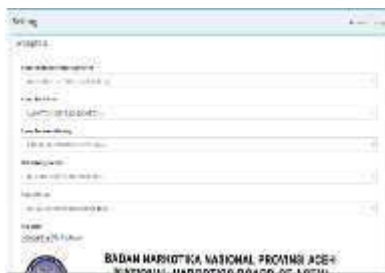
Gambar 0.8 Pengaturan Halaman Utama

Pengaturan Menu Utama adalah untuk mengubah biodata dihalaman utama apabila ada karyawan diganti di bidang tersebut serta pergantian kop surat terbaru. Bisa dilihat pada gambar 4.8.