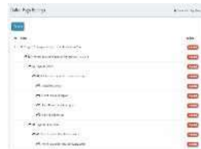
Gambar 0.5 Daftar Pagu Belanja

Daftar pagu belanja terdapat menu penambahan pagu belanja dan juga menampilkan daftar pagu yang sudah diinput, bisa dilihat pada gambar 4.5.