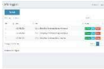
Gambar 0.7 Anggaran