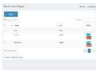
Gambar 0.9 Halaman pembuatan username dan password

Halaman ini digunakan untuk menambahkan username dan password untuk orang yang memiliki hak untuk membuat surat pengeluaran keluaran, bisa juga untuk ganti username ataupun password serta menghapus akun karyawan yang tidak lagi memiliki hak mengelola pengeluaran kas. Seperti pada gambar 4.9.