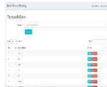
Gambar 0.11 Daftar Satuan Barang

Halaman ini digunakan untuk menambahkan satuan yang diperlukan di BNNP Aceh, bisa juga mengubah data satuan apabila terjadi perubahan dan juga menghapus satuan yang tidak diperlukan. Bisa dilihat pada gambar 4.11.