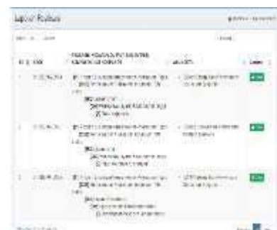
Gambar 0.12 Realisasi

Halaman ini digunakan untuk melihat tabel realisasi anggaran dan untuk mencetak anggaran yang diperlukan mengenai dana anggaran yang dihabiskan. Dapat dilihat pada gambar 4.12