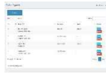
Gambar 0.4 Daftar Pegawai

Daftar pegawai terdapat menu menambahkan pegawai bisa mengedit nama pegawai yang salah diinput dan bisa juga untuk menghapus pegawai serta menampilkan data setiap pegawai, bisa dilihat pada gambar 4.4.