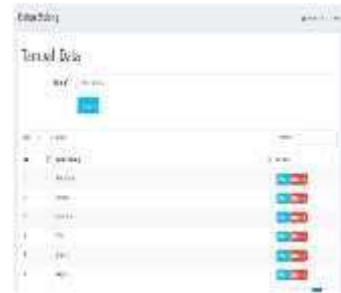
Gambar 0.10 Daftar Bidang