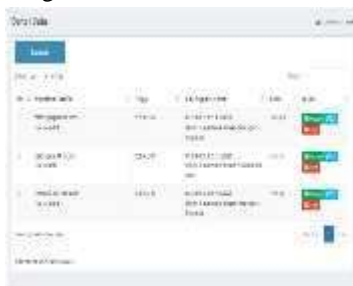
Gambar 0.3 Daftar Data

Halaman daftar data adalah menampilkan daftar data pengeluaran yang sudah diinput kedalam sistem dan juga bisa menambahkan daftar data uang lain, bisa mengubah data yang salah dan juga menghapus data yang tidak diperlukan, bisa dilihat pada gambar 4.3.