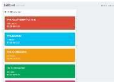
Gambar 0.2 Halaman Utama

Halaman Home merupakan halaman awal setelah login dari sistem laporan keuangan. Pada halaman ini menampilkan beberapa data pegawai yang mengelola keuangan seperti nama dan NIP, seperti pada gambar 4.2.