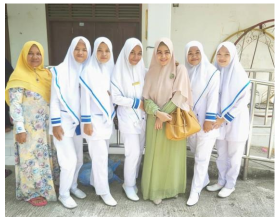
Gambar 2. Foto bersama setelah melakukan kegiatan

Berdasarkan dari hasil kegiatan pengabdian kepada Masyarakat yang dilakukan di Desa Klieng Cot Arun KEcamatan Baitussalam Kabupaten Aceh Besar. Para ibu hamil memberikan tanggapan yang positif dan telah memahami informasi yang diberikan dan disampaikan oleh pelaksana dan anggota.